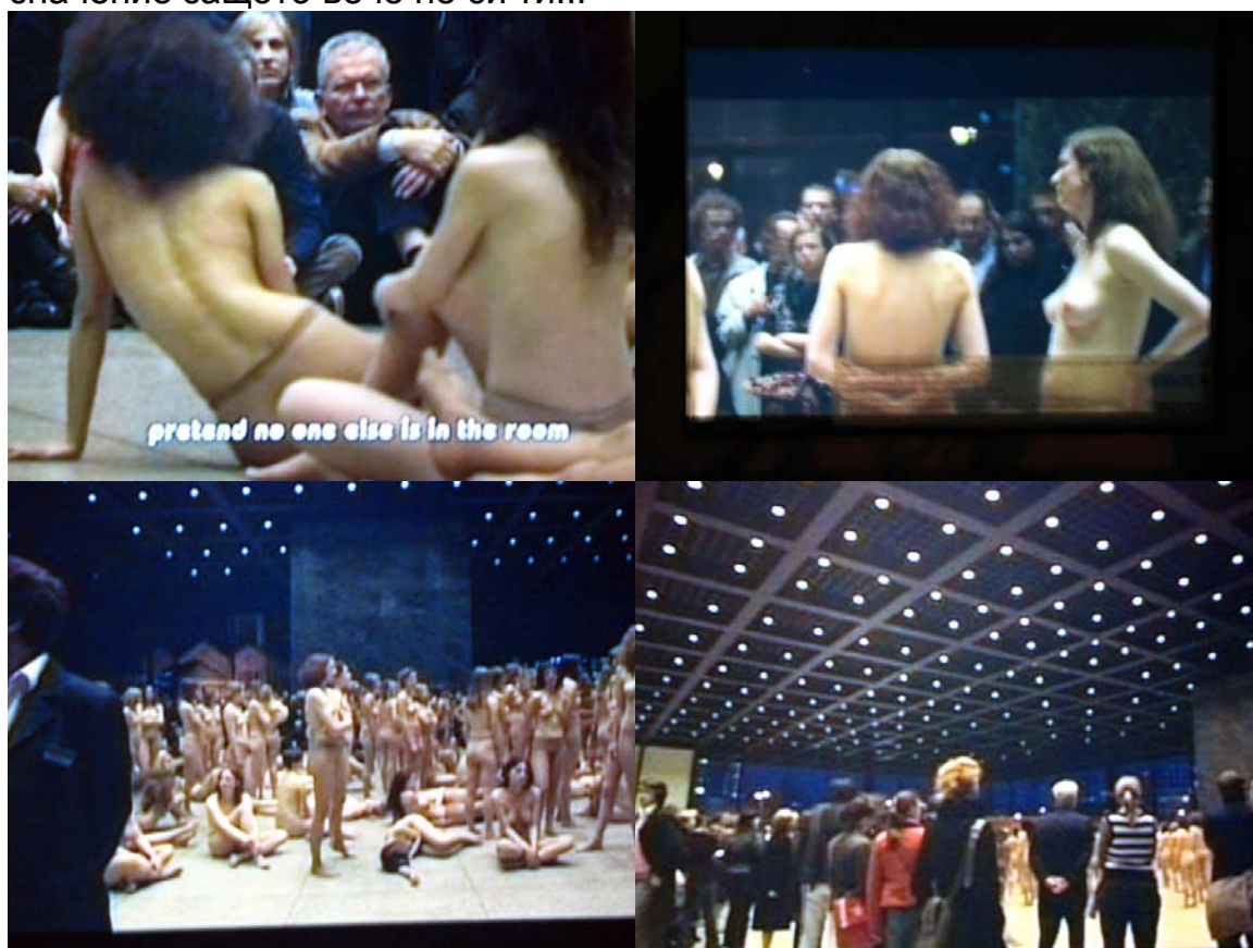
Оголени жени и публика снимки през съклото на мазето, където се прожектира видеото от vb55, Neue Nationalgalerie Berlin, 2005