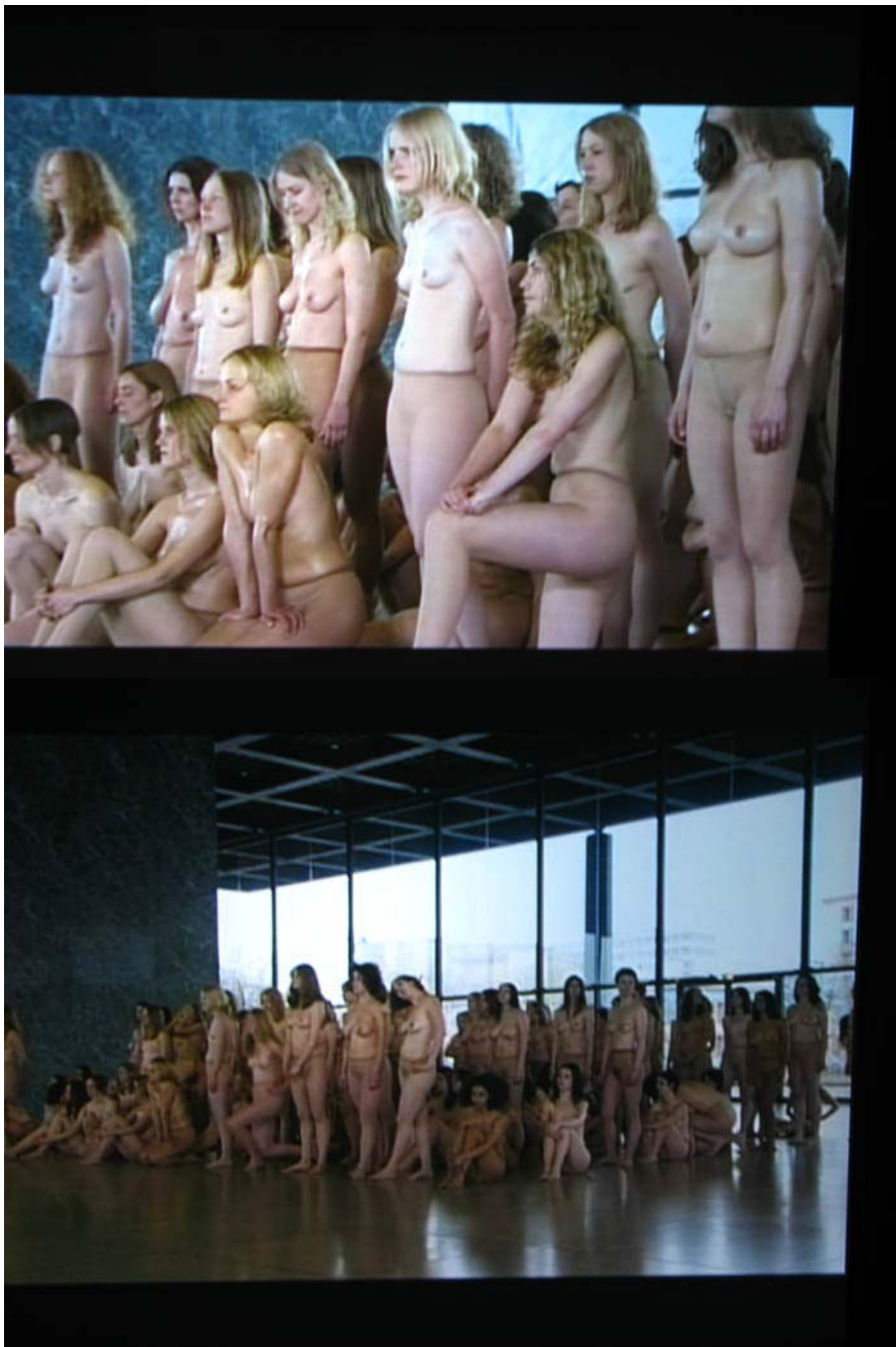
снимки през съклото на мазето, където се прожектира видеото от vb55, Neue Nationalgalerie Berlin, 2005

Германия. Имам чувството, че ако някой /чужденец/ ни поздрави по подобен начин, най-вероятно е да стане скандал.